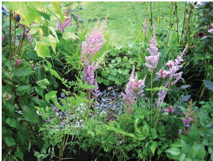
Det er vigtigt at plante tæt for at opnå et frodigt udtryk i regnbedet.

Du sikrer bedets frodighed bedst ved ikke at plante i for store grupper, men blande planterne mellem hinanden, som man også ser det i naturen.