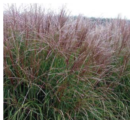
Elefantgræs i regnbed.

Det færdige bed ligger nu ca. 20 cm under terræn og er parat til at blive tilplantet.