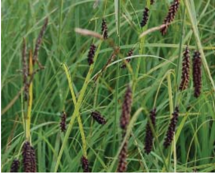
Carex flacca , Blågrøn Star (stedsegrøn)-god bundække 15(30) x 25, stedse, bund, maj-juni