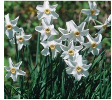
Narcissus Poeticus ,