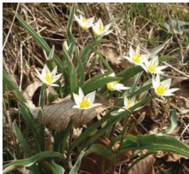
Tulipa turkestanica ,

Crocus nudiflorus 30-50 x 25, løv, sol, sep-okt