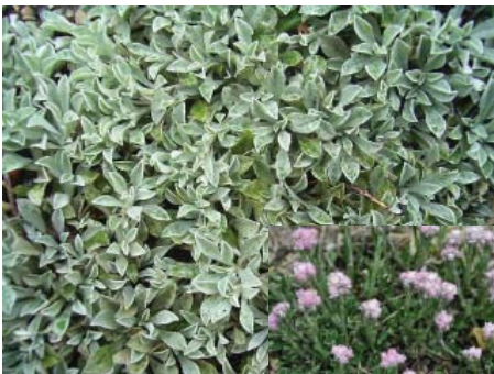
Antennaria dioica 'Nyewood'