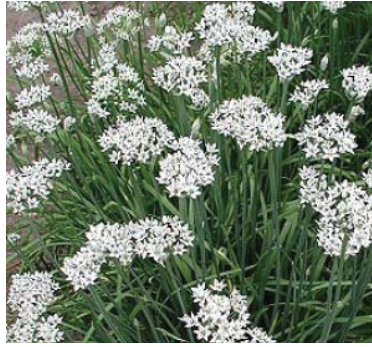
Allium tuberosum , (juli-oktober)