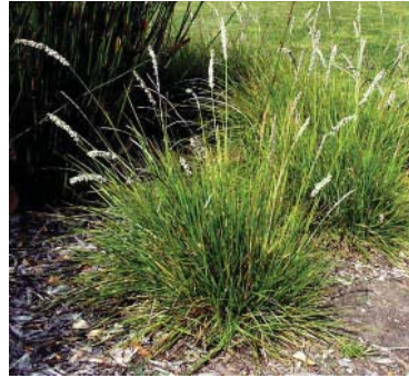
Sesleria autumnalis , 30 cm (50 cm) Blåaks 30 (50) x 25, stedse, sol/bund, aug-okt (lidt salt)