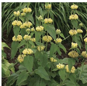
Phlomis russeliana , Løvehale 30-90 x 40, stedse, solitær/bund, juli/aug