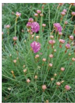
Armeria maritima , Engelsk græs 15-25x25, stedse, solitær, juli/sep, salt