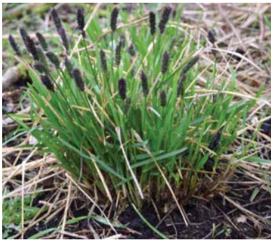
Sesleria heufferiana , Blåaks -god bundække 30(40) x 25, stedse, bund, marts (lidt salt)