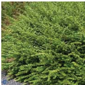
Lonicera pilata , Liguster-gedeblad 0,5-0,8m x 0,8, stedse, solitær