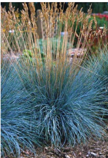
Festuca Élijah Blue' , 15-30 cm Blågrøn bjørnegræs 15 x 25, løv, sol/bund, juni/sep