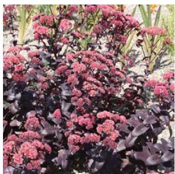
Sedum telephium 'Atropurpureum', Sankthansurt 50-60 x 25, stedse, solitær, aug-oktiber