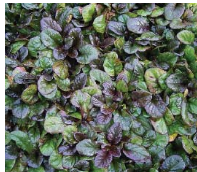
Ajuga reptans ,