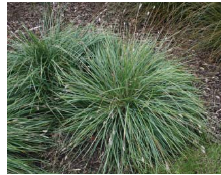
Sesleria nitida , Blåaks 50(80) x 25, stedse, sol/bund, april-maj (lidt salt)