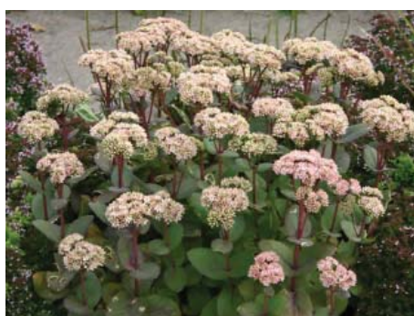
Sedum telephium 'Matrona', Sankthansurt 50-60 x 25, stedse, solitær, aug-oktiber