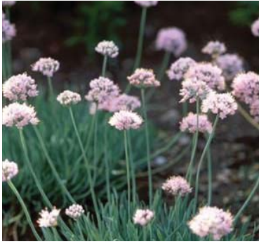
Allium senescens , (juli-august)